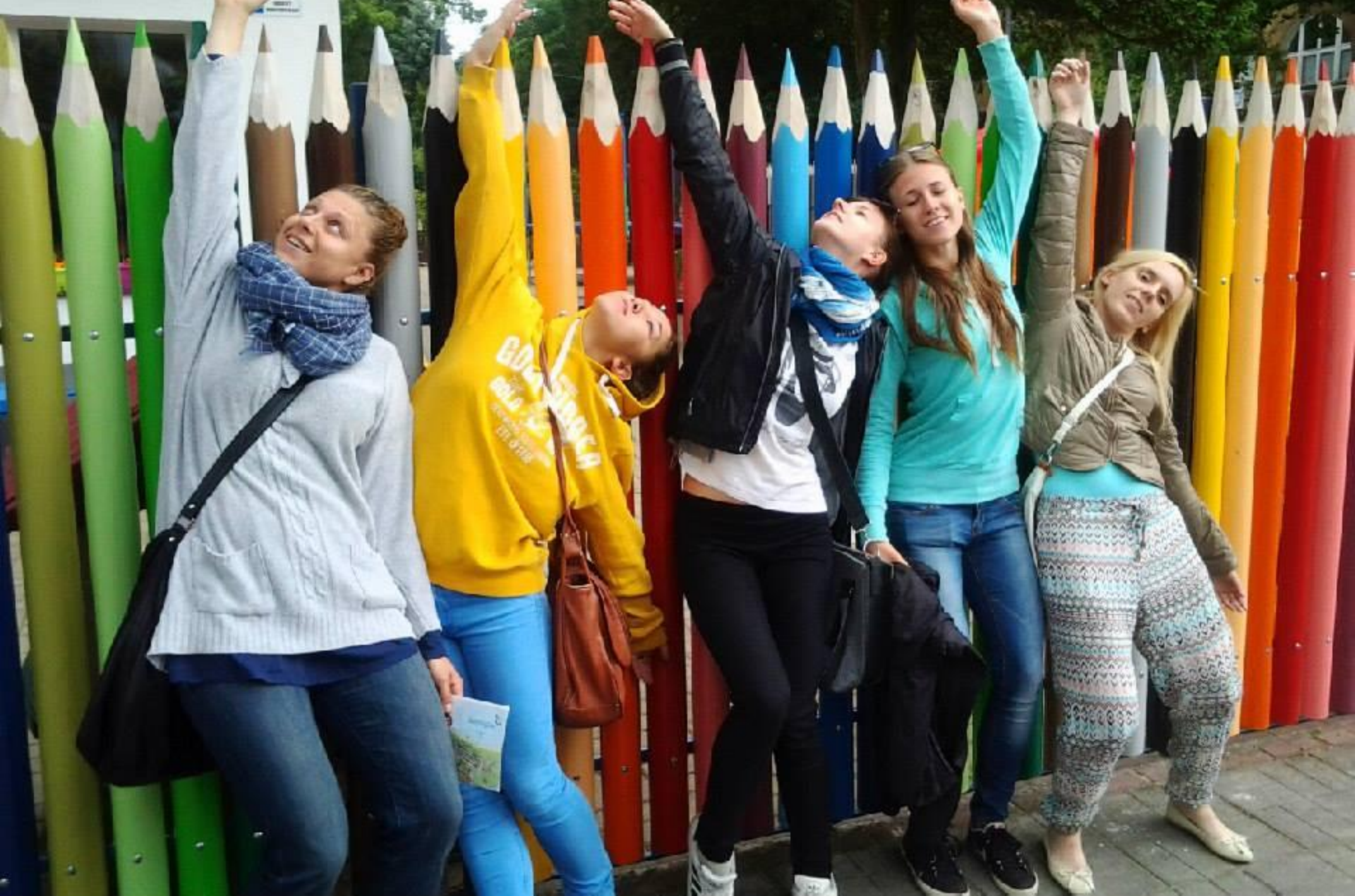
1 lipca – pokaz gościnny (spektakl „open/close „i „o obrotach”) podczas festiwalu Szalone Lato Tańca w Świnoujściu