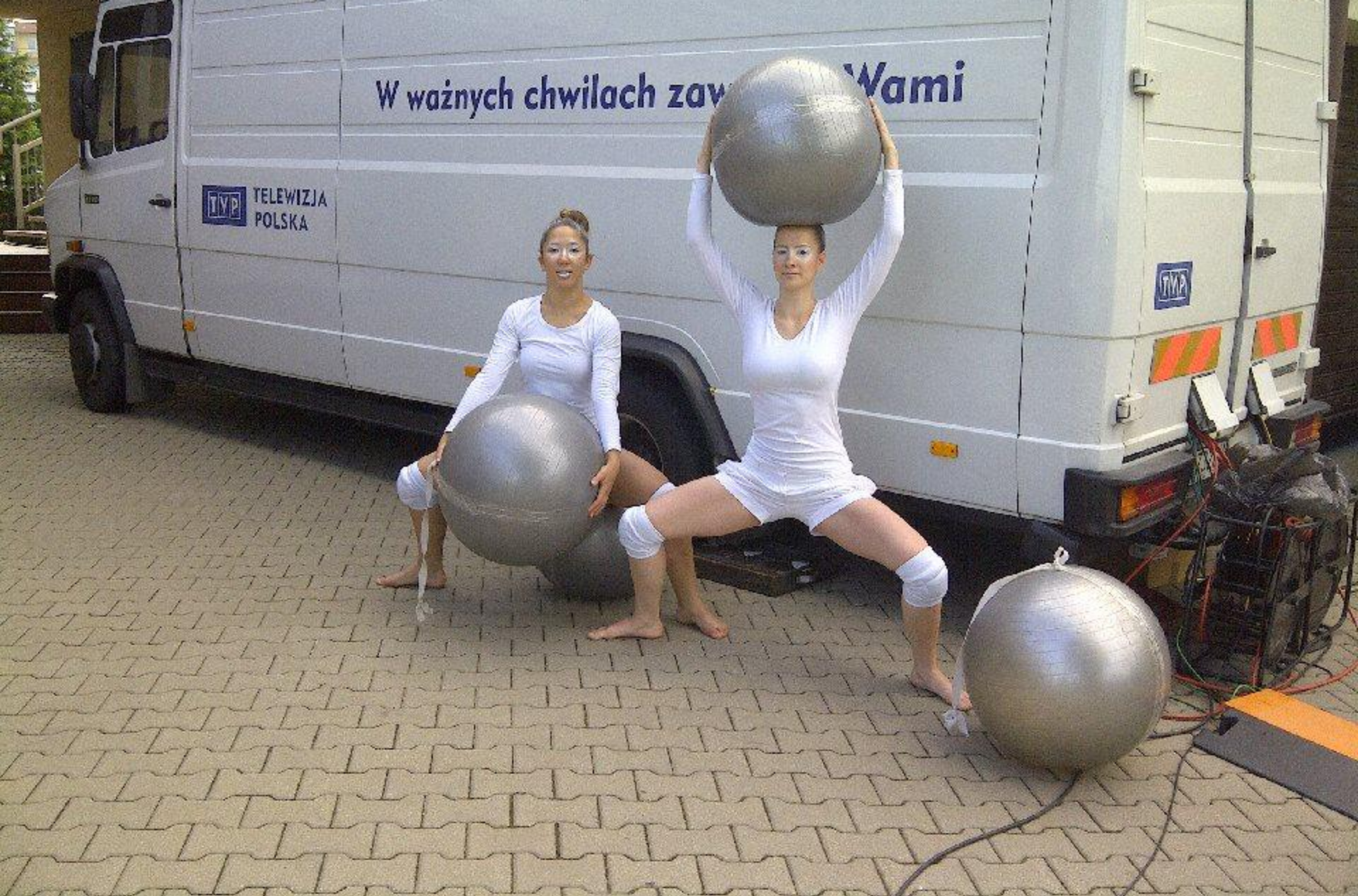
4 czerwca – występ w programie Kawa czy Herbata, Olsztyn