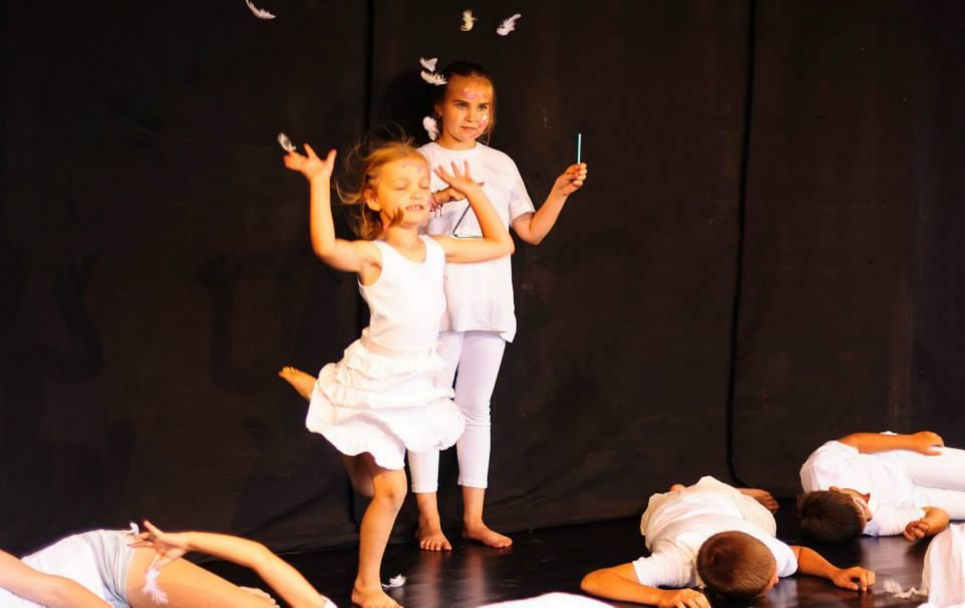
31 sierpnia - Pracownia Tańca Pryzmat i uczestnicy projektu LATO przez PRYZMAT TAŃCA i SZTUK RÓŻNYCH na VIII FESTIWALU TEATRÓW AMATORSKICH "POD BRZOZĄ" w Bartągu