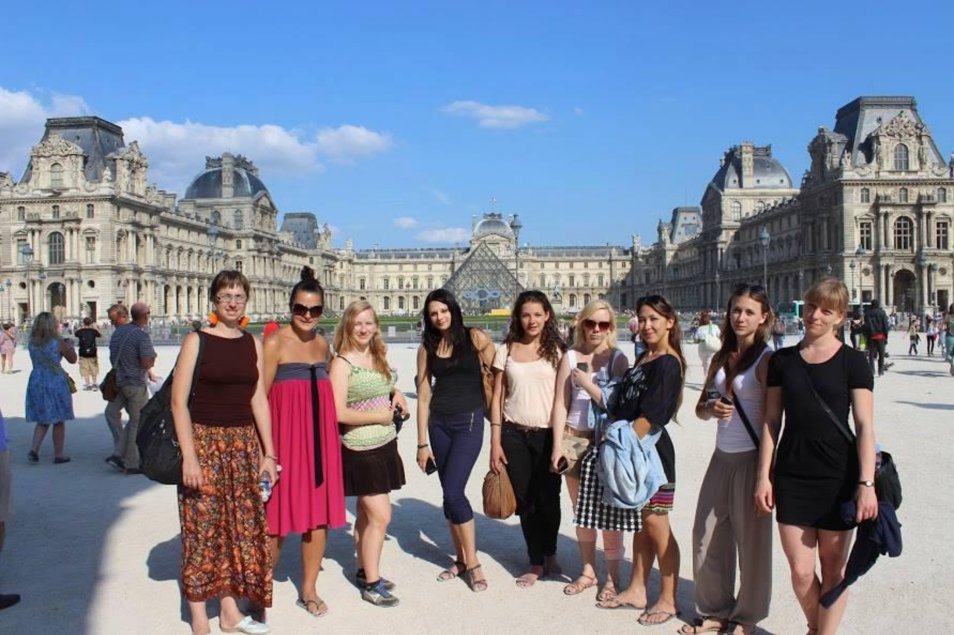
5-13 lipca – Paryż, festiwal; warsztaty i pokazy Le Stage International de Danse